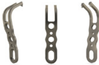
PLACA MALÉOLO MEDIAL H2