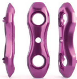
PLACA BLOOP - SINDESMOSIS TIBIOPERONEAS