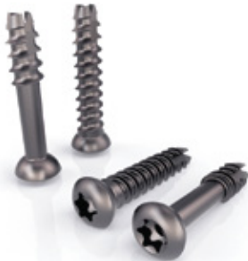
TORNILLO SLY PEQUEÑO

DISTAL FIBULA LOCKING PLATE - 2.7/3.5 MM