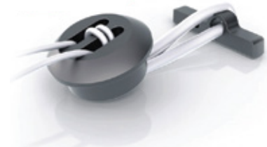
FLOOP - BUTTON LOOP REGULABLE PARA SINDESMOSIS DE TOBILLO

FLOOP - ADJUSTABLE BUTTON LOOP FOR ANKLE SYNDESMOSIS