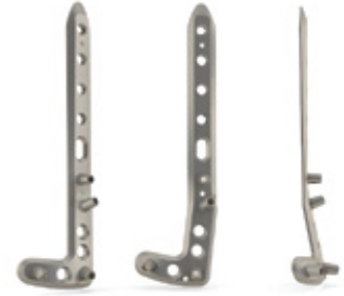
PLACA PARA TIBIA DISTAL ANTEROLATERAL BLOQUEADA 3.5 MM

ANTERIOR-LATERAL DISTAL TIBIA LOCKING PLATE - 3.5 MM.