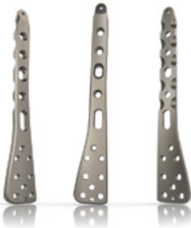
PLACA PARA TIBIA DISTAL BLOQUEADA 3.5 MM

ANTERIOR-LATERAL DISTAL TIBIA LOCKING PLATE - 3.5 MM.