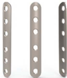
PLACA 1/3 DE TUBO DUO BLOQUEADA 3.5 MM

LOCKING ONE THIRD TUBULAR DUO PLATE 3.5 MM