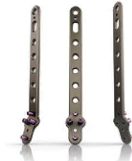
PLACA PARA PERONÉ DISTAL BLOQUEADA 2.7/3.5 MM

LOCKING ONE THIRD TUBULAR DUO PLATE 3.5 MM