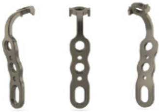
PLACA MALÉOLO MEDIAL H1

COMPLEMENTARY SYSTEMS - OSTEOSYNTHESIS ANKLE SYSTEM